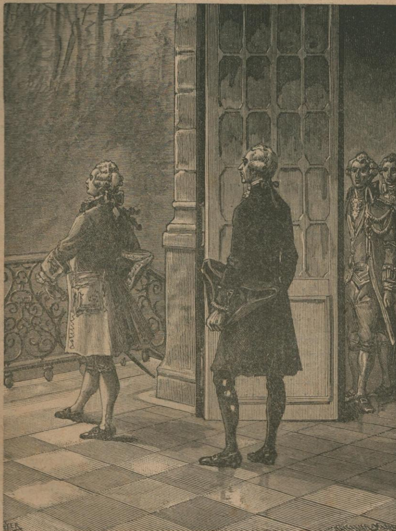
M. de commandeur de Boisfleury groette hen. (Blz. 16).

De mannen waren om de flesschen gegroepeerd, terwijl de vrouwen onderaan het kakelen waren en spraken over bloedverwanten en vriendinnen. De commandeur wandelde in haar midden rond, bekeek iedereen met vriendelijk doch al te vrijpostig oog en sprak hier en daar een liefvallig woord tegen een vrouw.